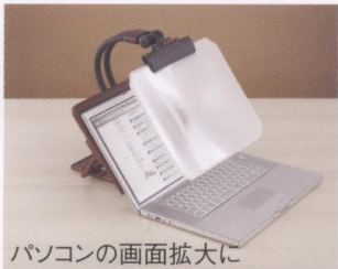
パソコンの画面拡大に